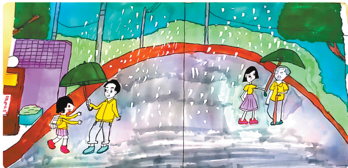
▲倾斜的雨伞 东环路小学三(4)班 王子琪