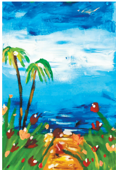
缤纷夏日 福佑路小学三(1)班 陈婉婷 (指导老师:梁亚阁)