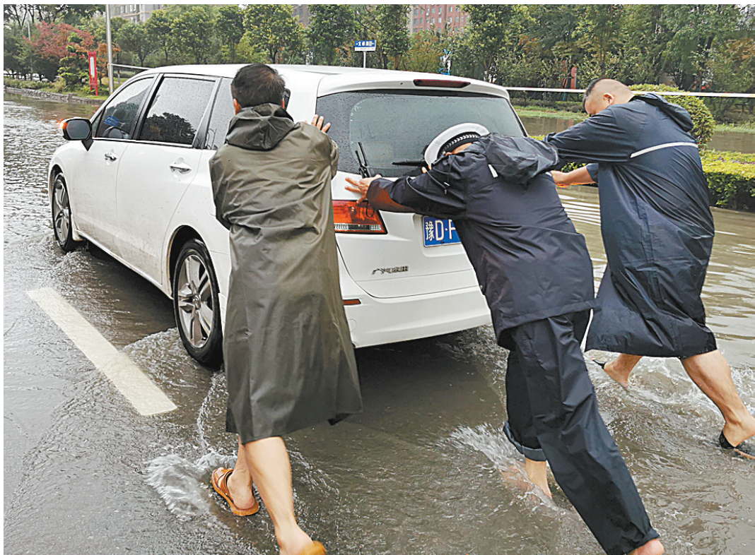
7月21日上午,在宝丰县文峰路中段,在此执勤的交警帮路人推出因进水在路上“趴窝”的汽车。