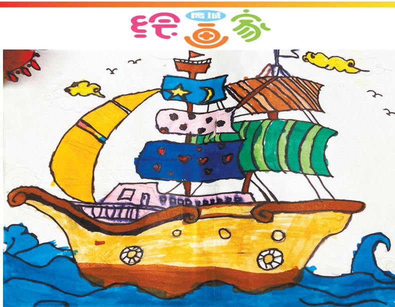
船 新华路小学三(4)班 张梓铭