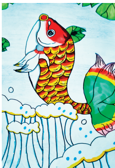
鱼跃龙门 公明路小学四(2)班 陶凤川