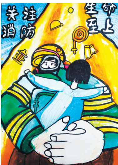
关注消防 生命至上 公明路小学一(1)班 白承霖 (指导老师:王莉娟)