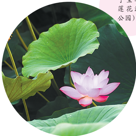
初绽(摄于宝丰县莲花湿地公园)