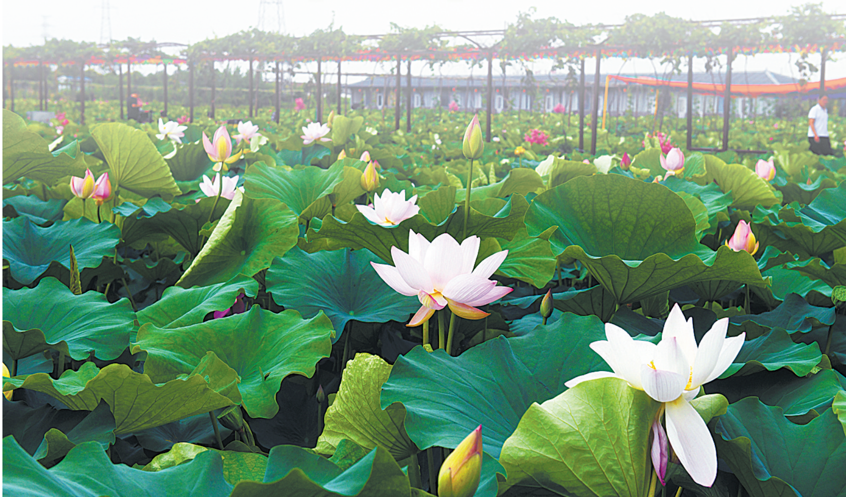
风过荷塘(摄于宝丰县莲花湿地公园)