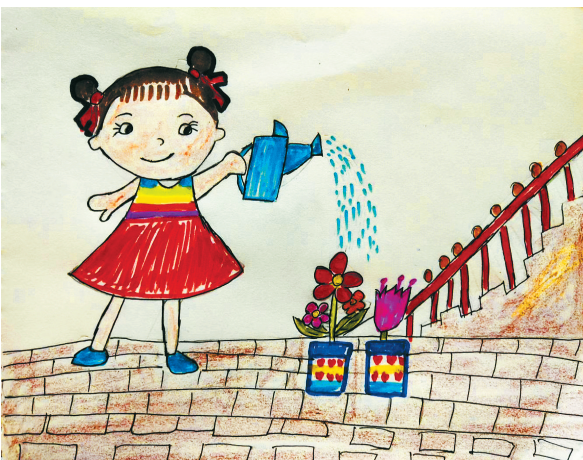
我给小花浇水 新程街小学一(3)班 张锐依