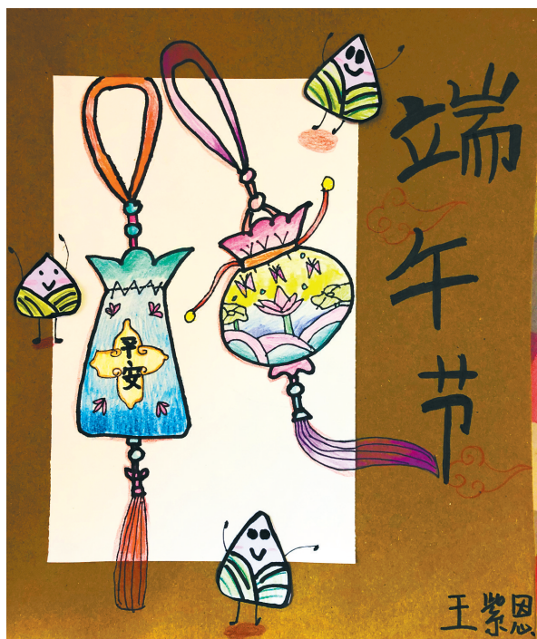
端午节 新华路小学二(7)班 王紫恩