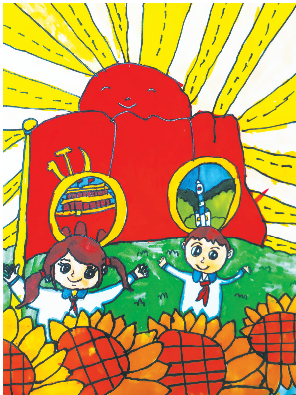
庆祝建党一百周年 湖光小学一(2)班 闫洋雪