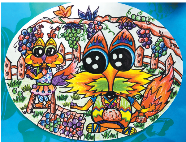
葡萄熟了 湖光小学三(4)班 刘芊彤 指导老师:王楠楠