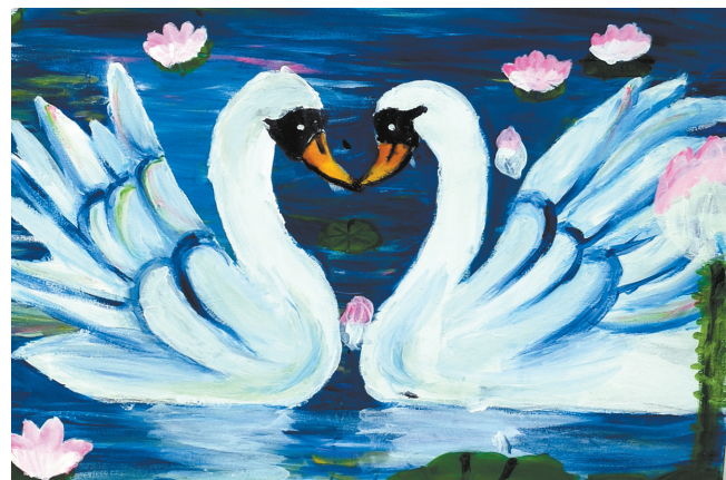
天鹅 翠林蓝湾小学四(2)班 李宜歆