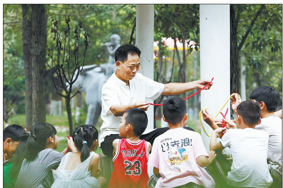
魔术进社区活动中,孩子们跟随老艺人学习魔术技巧