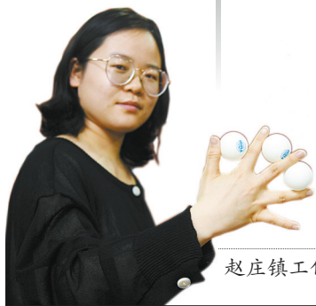
赵庄镇工作人员随手表演魔术《空手抓乒乓球》

宝丰魔术是指流传于宝丰县赵庄、肖旗、商酒务等乡镇的“翻大箱,玩把戏”等民间文艺活动,发展于明清,兴盛于当今,已有数百年的历史,近期被评选为国家级非物质文化遗产。宝丰魔术曾是当地百姓的重要谋生手段,如今已成为我市一张知名旅游名片。近年来,宝丰县建起魔术传习所8个,还发起魔术进校园、魔术进社区等活动,以公益课的形式推广魔术,促进其传承和发展。