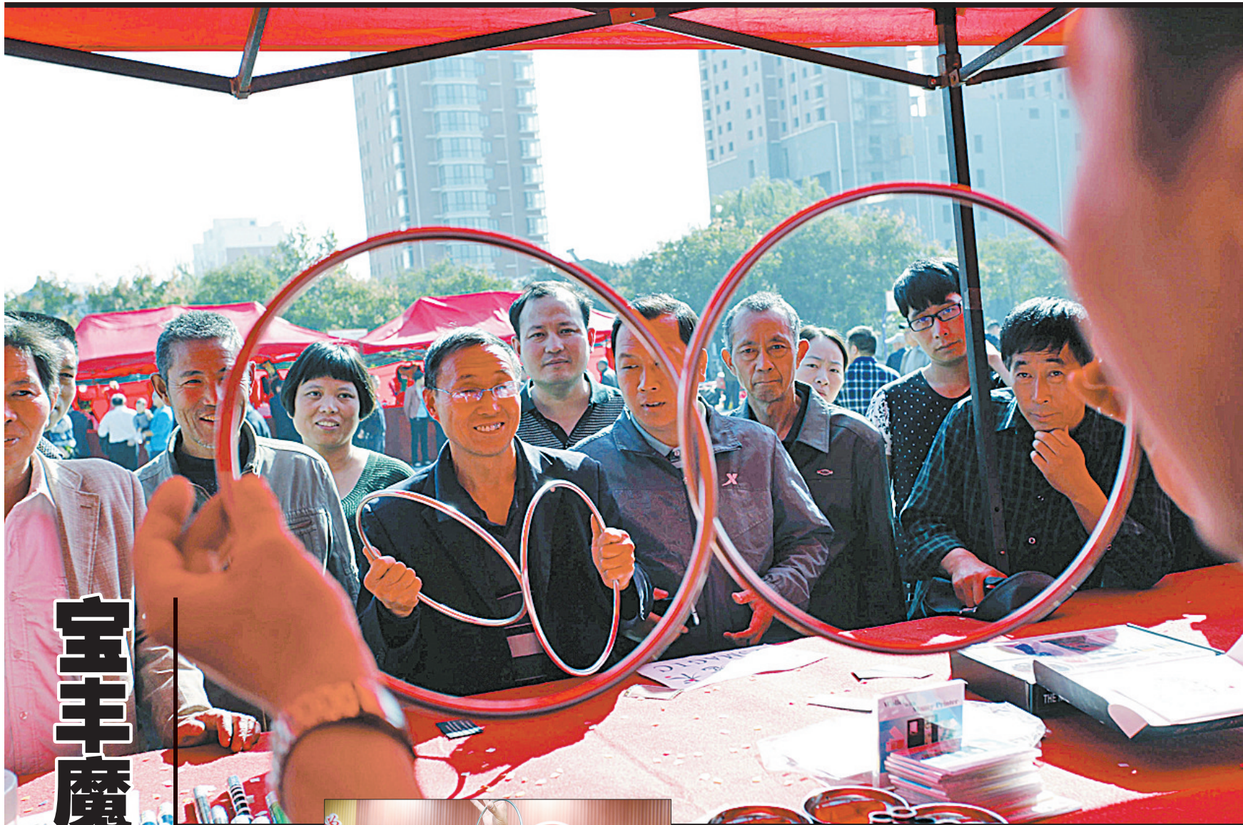
宝丰魔术引人关注