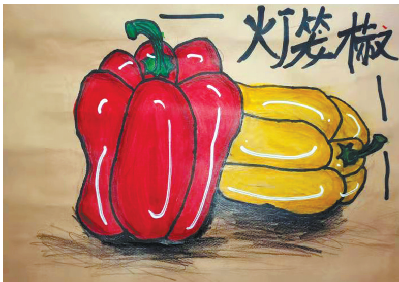
灯笼椒 公明路小学一(3)班 吴锦萱 (指导老师:连亚娟)