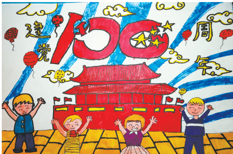
庆祝建党100周年 东环路小学二(5)班 赵晗冰