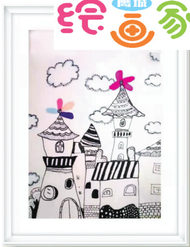
风车房 东环路小学二(2)班 张纹菲