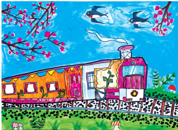
开往春天的火车 湖光小学二(1)班 朱梓瑄