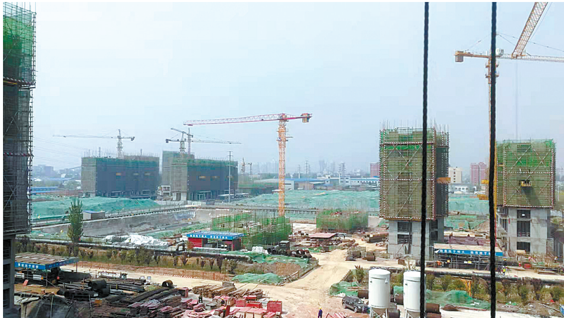
平顶山国际物流产业新城建设工地

一座新城该怎么造？有识之士都认识到，光盖房子这条路已经走不通了。建了城要让人住进来，得有学校、医院、商业中心等配套资源，但最重要的是还要有产业做支撑，让住在这里的人有职业，有事业。有产业，一座城才能持久繁荣。