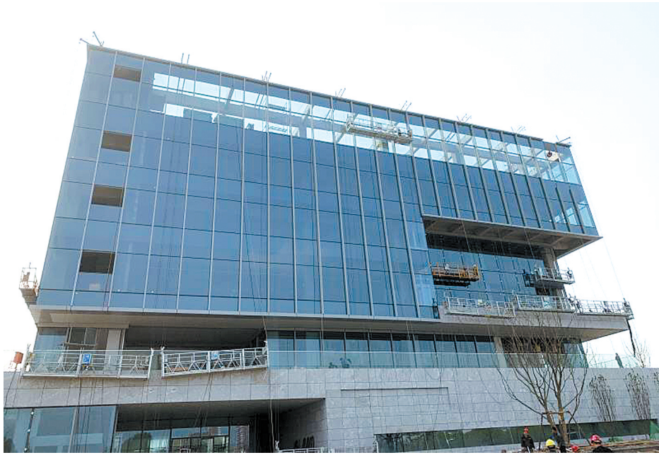
4月10日，工人在对东湖艺术展示中心进行最后的施工