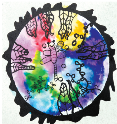
梦幻池塘 开源路小学一(5)班 刘坤琦