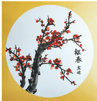
迎春 体育路小学五(1)班 王宝迪