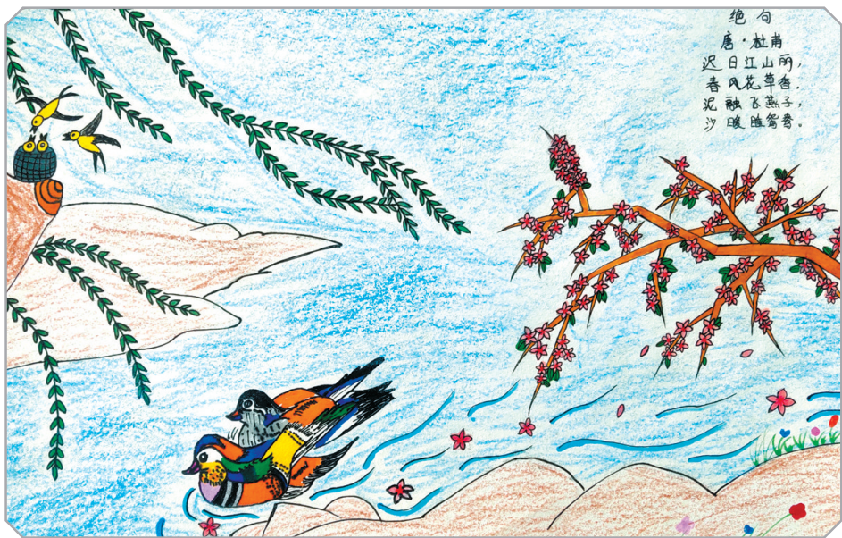
春 公明路小学一(3)班 吴炫诺 指导老师：连亚娟