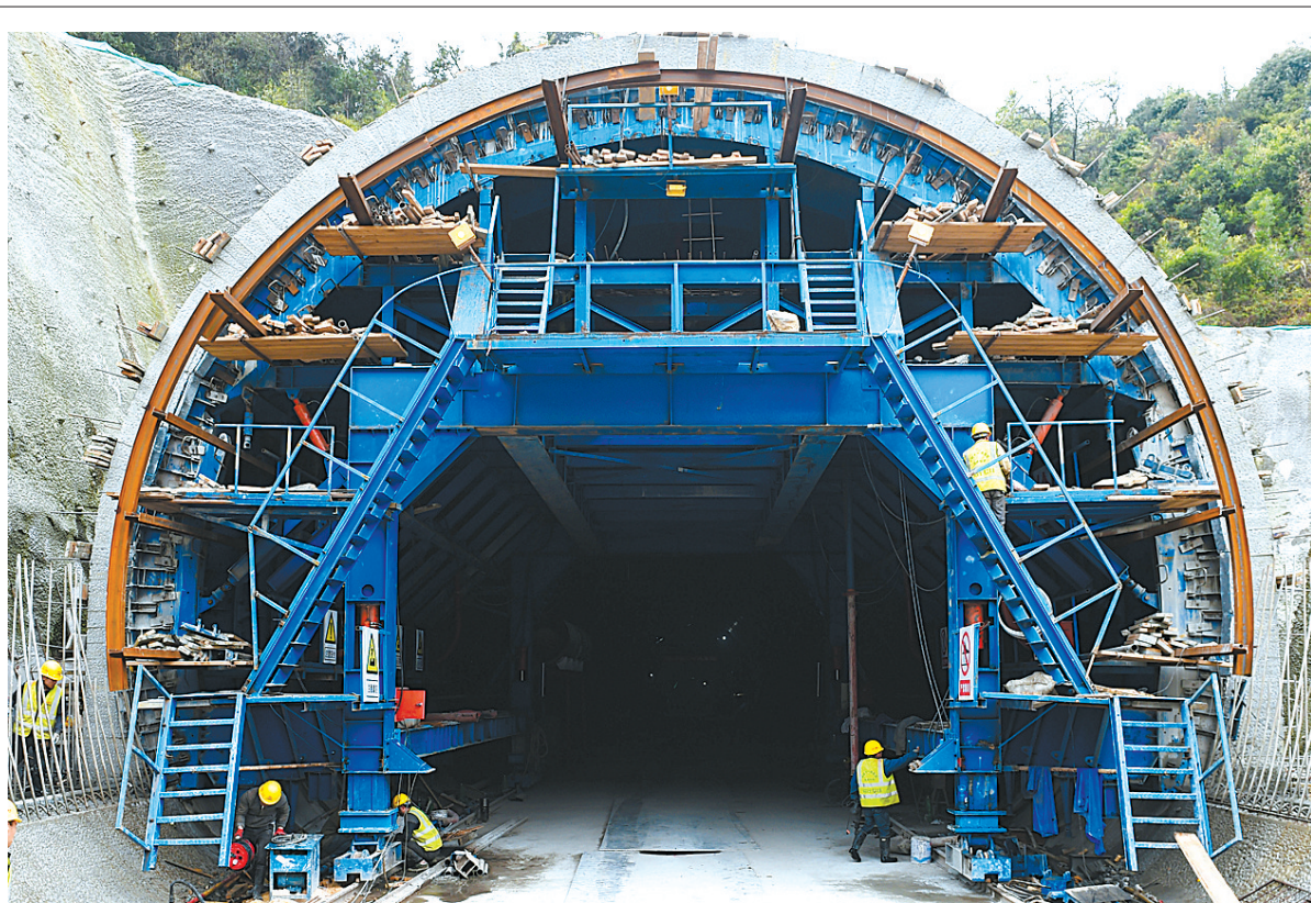
安徽:池黄高铁建设有序推进

目前,鄂尔多斯市、达拉特旗两级纪委监委已成立了联合调查组,启动追责问责程序,正在对相关问题进行调查;鄂尔多斯市政府启动应急预案,对达拉特旗周边旗区同步进行相关排查工作。