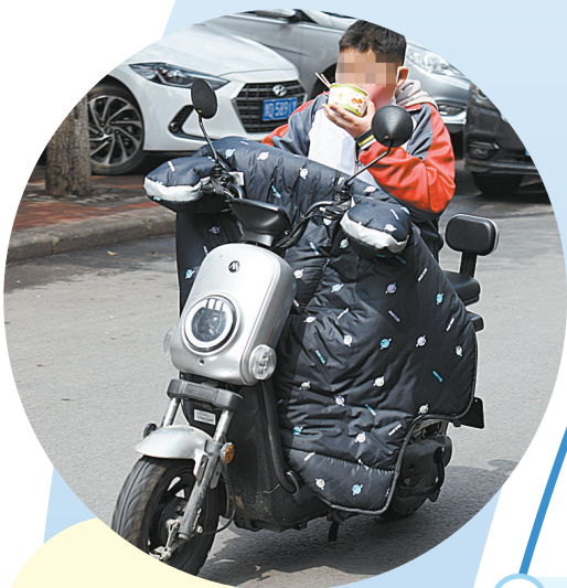
一位中学生边骑电动车边吃东西

向广大师生讲述青少年驾驶电动车的危害,提高自身交通安全意识。据了解,“全国中小学生安全教育日”来临之际,市公安交管支队发给全市中小学校师生、家长一封信,要求学生骑自行车须年满12周岁,骑电动自行车须年满16周岁,并需佩戴安全头盔。要求学校对学生上下学交通方式进行排查,严格禁止未达法定年龄骑电动车上下学,对违法学生发现一起制止一起。