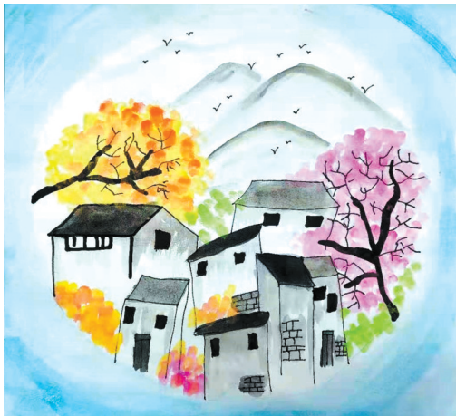
春色 公明路小学二(3)班 王赞羽 (指导老师:周亚星)