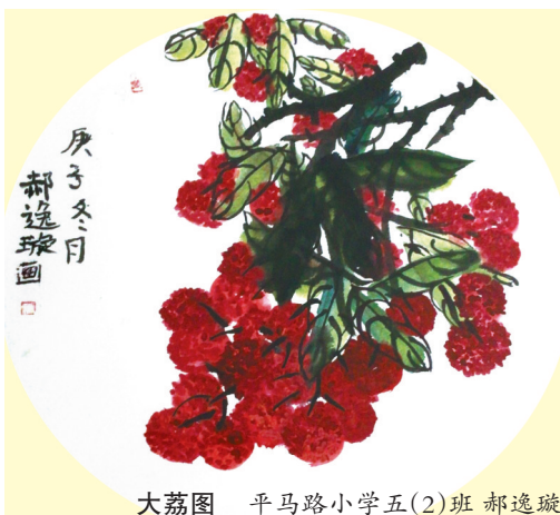
大荔图 平马路小学五(2)班 郝逸璇