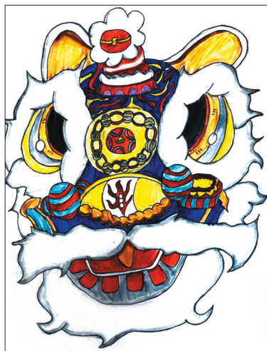
舞狮子 沁园小学四年级(2)班 石运