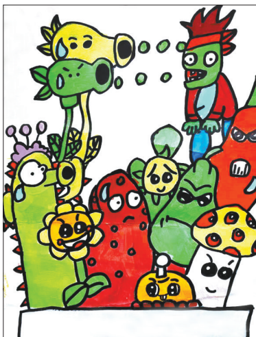
植物大战僵尸 新新街小学二(4)班 郭浩然