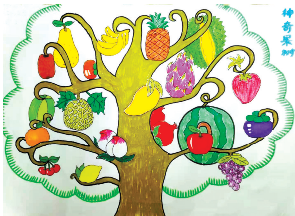
神奇果树 新鹰小学二(3)班 邢心一