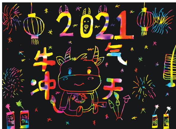
牛气冲天 五条路小学三(5)班 王祖达 (指导老师:靳娇旭)