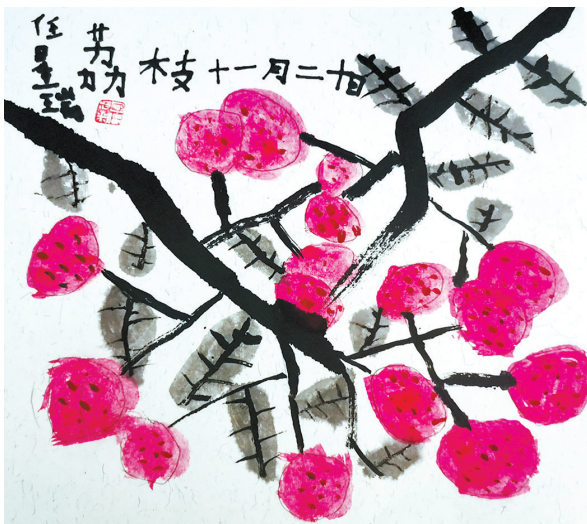
荔枝 建东小学一(1)班 任星瑞