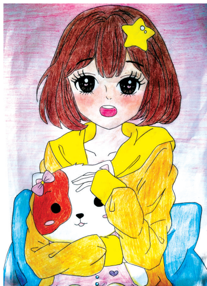
明眸女生 姚孟小学五(1)班 闫梦涵