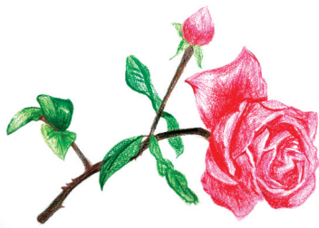
一枝独秀 沁园小学四(2)班 刘芝雨