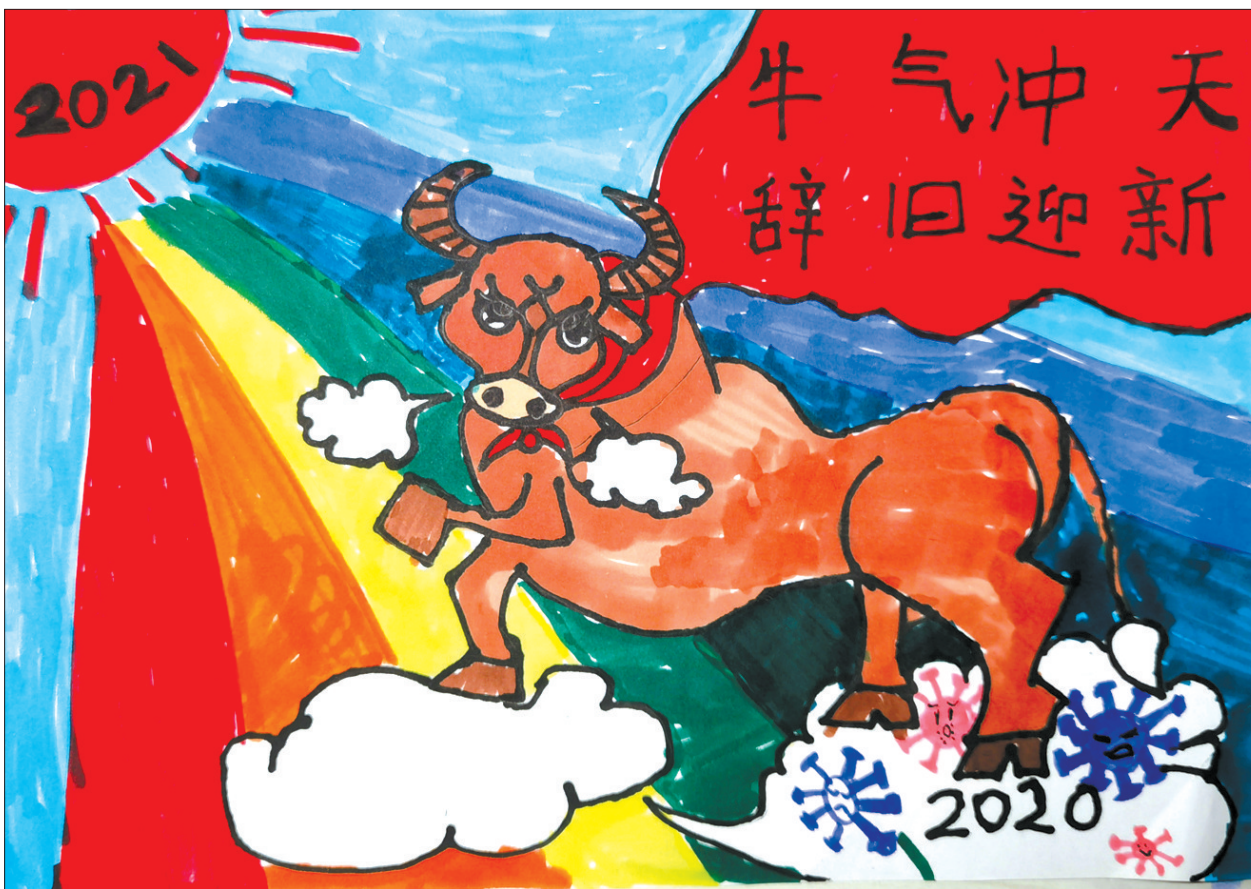
牛气冲天 体育路小学一(7)班 张瀚元 (指导老师:丁亚丽)