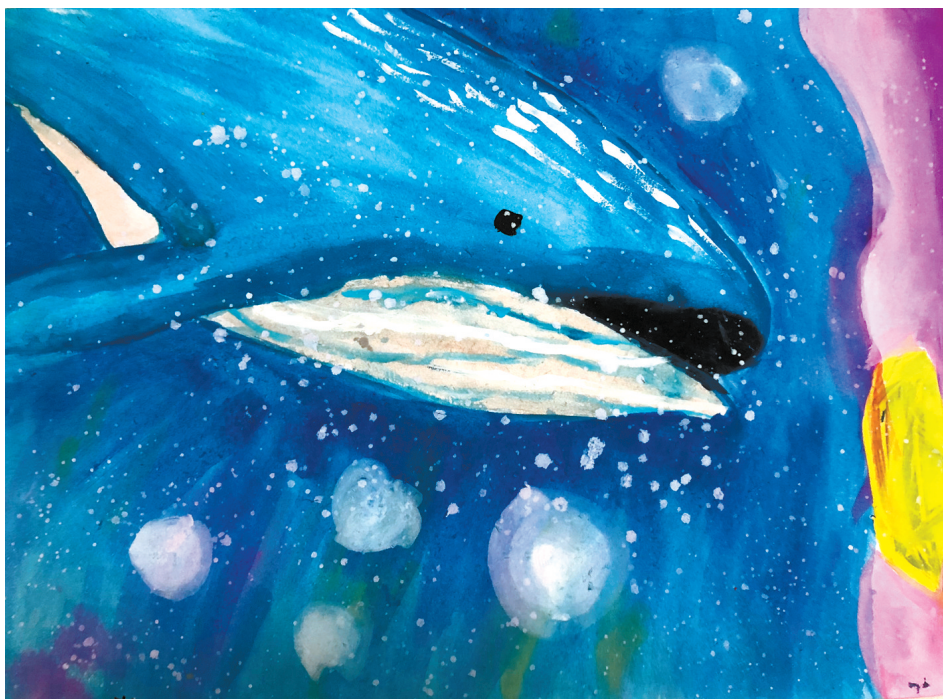
鲸 公明路小学四(2)班 秦宇泽 指导老师：摆灿灿

现在你们知道我是谁了吗？对，这就是我，一个每天陪伴小主人学习的“美女”小书包。 (指导老师：张变变)