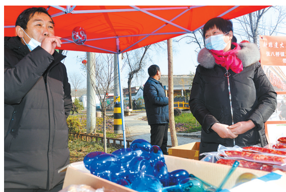
在宝丰县非遗大集上,商贩销售北郎店社区生产的“琉璃不对儿”