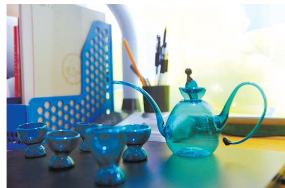
如今,北郎店社区艺人还能吹制酒具等工艺品