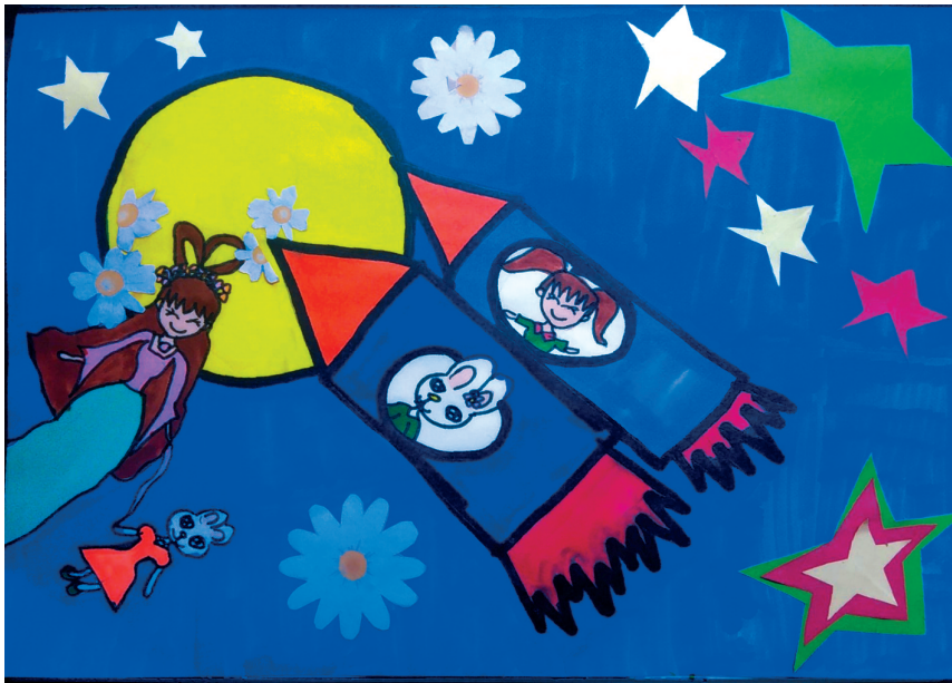
嫦娥姐姐,来客人啦! 乐福小学 四(2)班 王伊茹