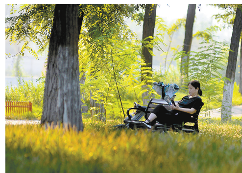
稻香路湛河桥南岸西侧,市民在休闲