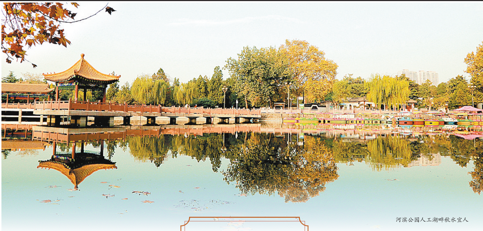
河滨公园人工湖畔秋水宜人