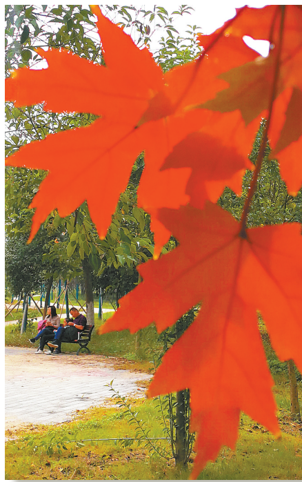
白鹭洲国家城市湿地公园的红枫叶