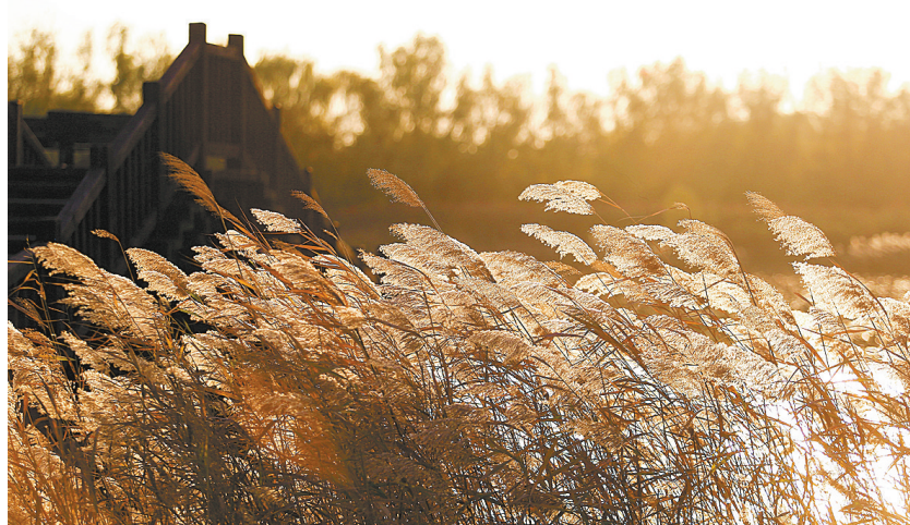
白龟湖湿地公园落日下的芦苇