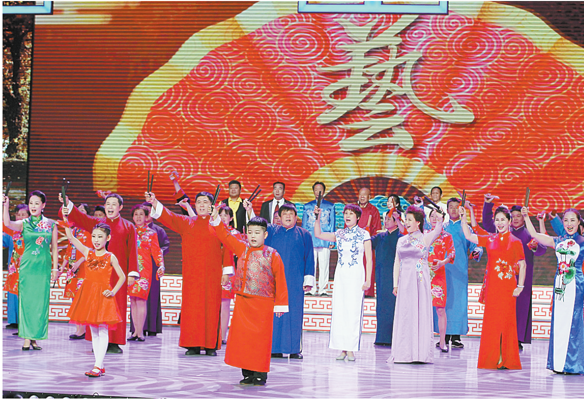
我市演员在第十届中国曲艺节现场闭幕演出中表演曲艺联唱《金秋欢聚平顶山》。

第十届中国曲艺节平顶山市组委会相关负责人说,曲艺是我国传统文化的瑰宝,具有独特而丰厚的艺术魅力,深受广大人民群众欢迎和喜爱。平顶山是中国曲艺城,文化底蕴深厚,曲艺历史悠久,绵延700多年的“马街书会”长盛不衰,作为我国曲艺艺术的母亲河,滋养着一代又一代曲艺艺人。多年来,平顶山高度重视文化建设,大力实施文化强市战略,引导发展民间文化,传承创新曲艺艺术,积极举办活动赛事,着力培育文化产业,全市曲艺事业欣欣向荣、蓬勃发展。