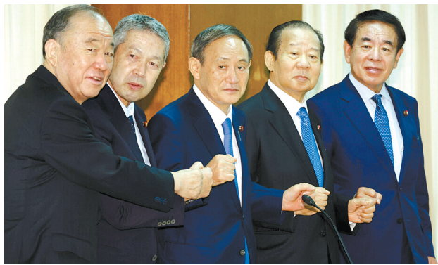
从左至右分别为山口泰明、佐藤勉、菅义伟、二阶俊博和下村博文

据日本《读卖新闻》15日报道,自民党执行部由干事长、总务会长、政务调查会长和选举对策委员长组成,负责党内最主要的工作,为仅次于总裁的“四大要职”。15日确定的新任高层