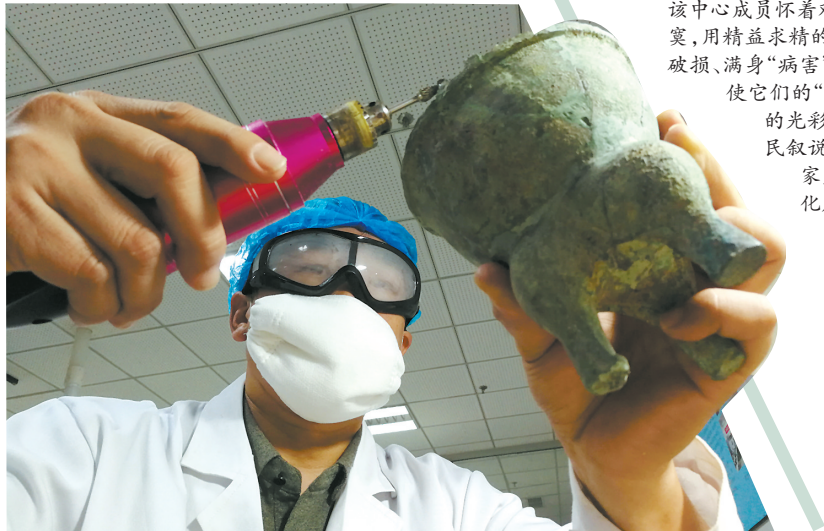
青铜器修复时需要细细地打磨,工作人员须戴上护目镜和口罩防止粉尘进入眼睛和口鼻