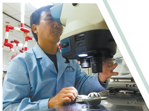
工作人员用超景深显微镜修复文物