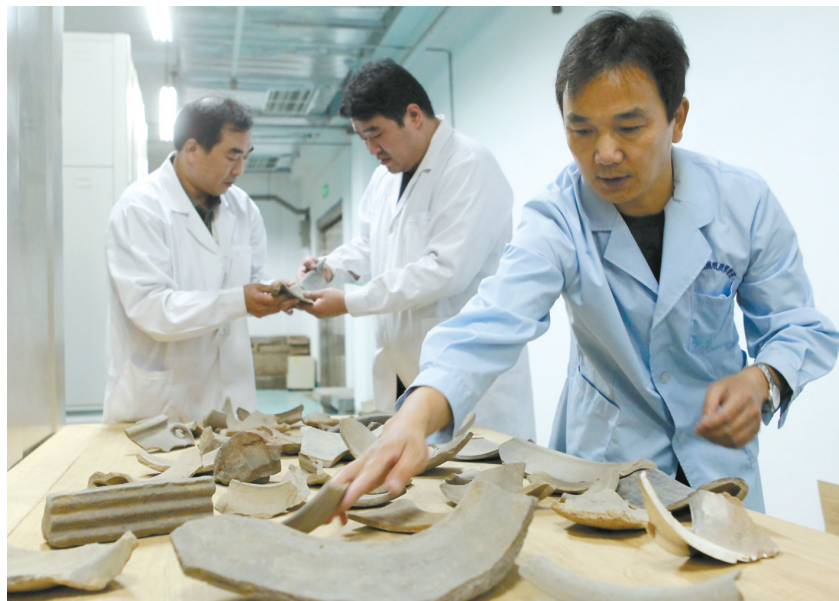
从出土碎片中挑选、拼接、复原出土文物,是最耗费工作人员精力和体力的流程