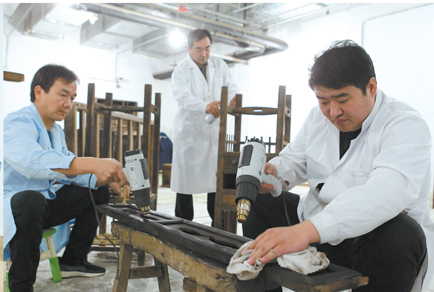
近代木质文物的外表需要封蜡保护,工作人员要逐件耐心烘干