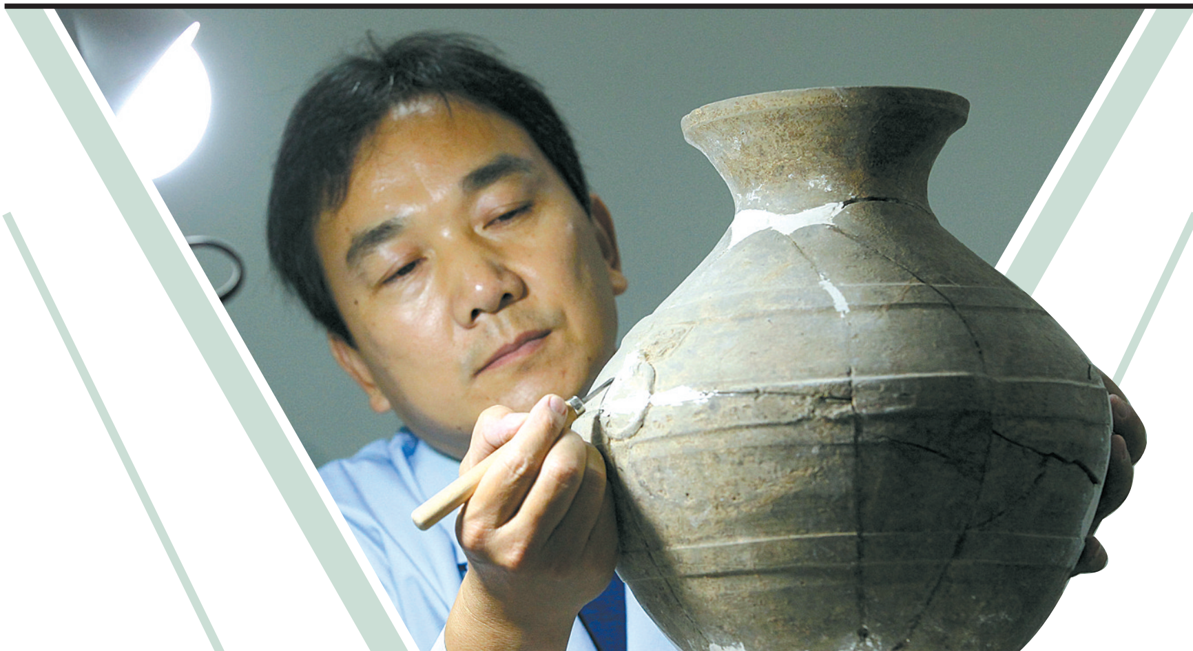
在修复陶器外表纹饰时,工作人员使用刻刀精心雕琢,使其与原有图案保持一致