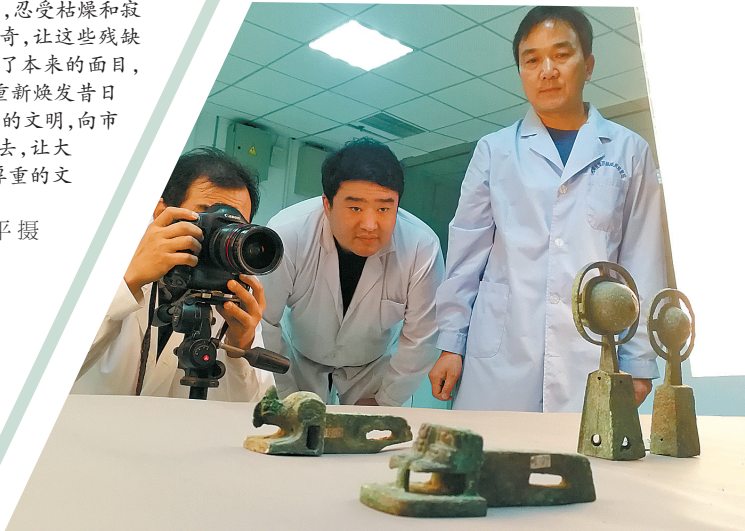
文物修复的每个阶段都要用相机拍照记录、存档