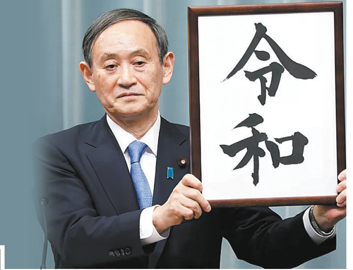
2019年4月，在万众瞩目的新年号发布会上，菅义伟代表安倍政府宣布新年号“令和”，由此获得“令和大叔”的绰号。

日本内阁官房长官菅义伟9月14日当选执政党自民党总裁。他将在定于9月16日召开的国会临时会议上被推选为日本新首相，正式接替8月底宣布辞职的安倍晋三首相。