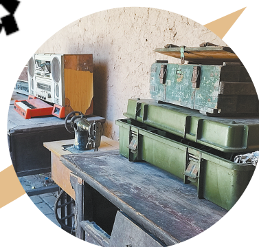
民房内集中展示的老物件