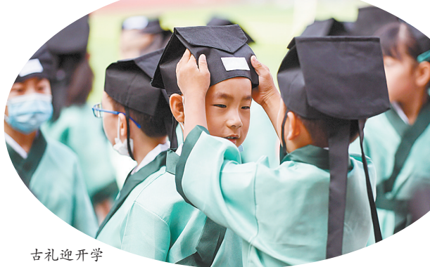
古礼迎开学

全尾鲢鱼、豆腐干葱、两个红鸡蛋。寓意分别为勤学当官、跃入龙门、聪明伶俐、连中双元。