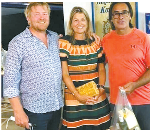
荷兰国王(左)、王后(中)与餐厅老板合影

当地时间8月24日,这对夫妇就此事在社交媒体上发声。他们在推文中写道:“我们当时没有注意保持社交距离。我们应该这样做,因为在度假期间遵守疫情规则对于控制新冠病毒是不可避免的。”