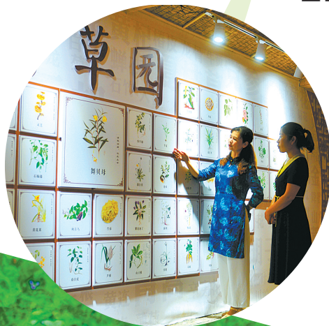
游客在中医文化科普馆浏览中草药知识