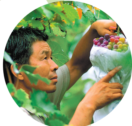
誉森生态农业专业合作社的葡萄园中，村民正在采摘葡萄

据尹集镇党委书记郭志刚介绍，尹集镇共有19个行政村，近年来，该镇坚持生态名镇、旅游兴镇的发展思路，依靠周边的二郎山、九头崖等丰富的山水资源，依据各个乡村的不同特色，以景区为龙头，以河湖为线，发展农业文化+旅游，打造大旅游格局，目前已打造了姬庄村“百草园”、蔡庄村“百果园”、李庄村“百花园”等7个特色村庄，“村村有特色、处处有景点，风景墙、别墅房，家家有项目、户户奔小康，乡村振兴栽下梧桐树，满天飞来金凤凰”。