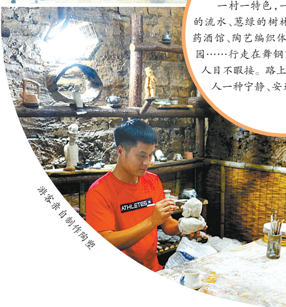
游客亲自制作陶塑

一村一特色，一步一景点。潺潺的流水、葱绿的树林、药茶馆、药膳馆、药酒馆、陶艺编织体验馆、百草园、百果园……行走在舞钢市尹集镇的村庄，让人目不暇接。路上游人如织，但仍给人一种宁静、安逸的感觉。