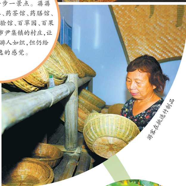
游客在挑选竹制品