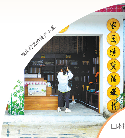
姬庄村里的特产小屋