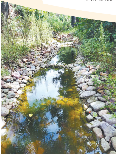
双龙泉河流水潺潺