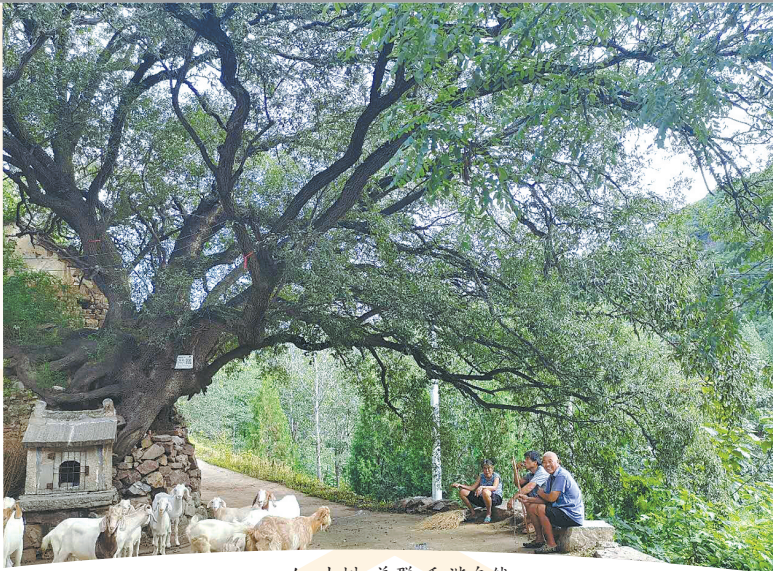
人、古树、羊群,和谐自然