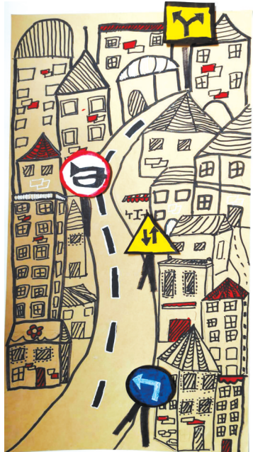
风情小镇 五条路小学二(2)班 赵子墨