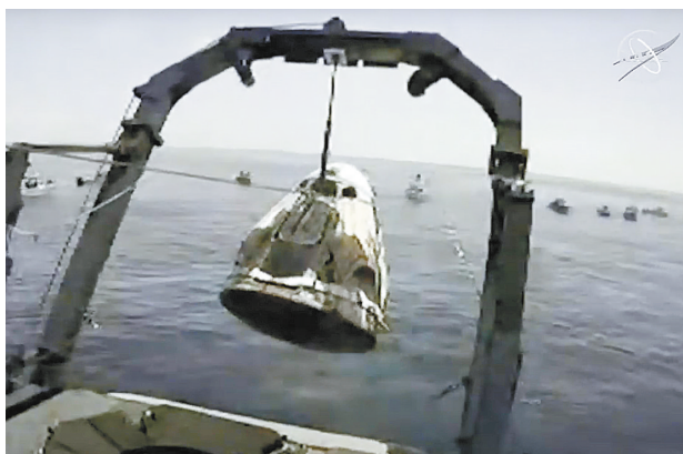
这张美国航天局8月2日发布的视频截图显示,回收船在美国东南部佛罗里达州附近的墨西哥湾打捞太空探索技术公司“龙”飞船。