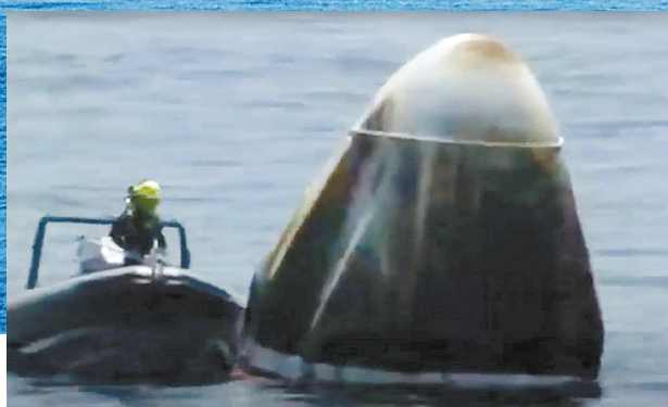
这张美国航天局8月2日发布的视频截图显示,太空探索技术公司“龙”飞船溅落在美国东南部佛罗里达州附近的墨西哥湾。