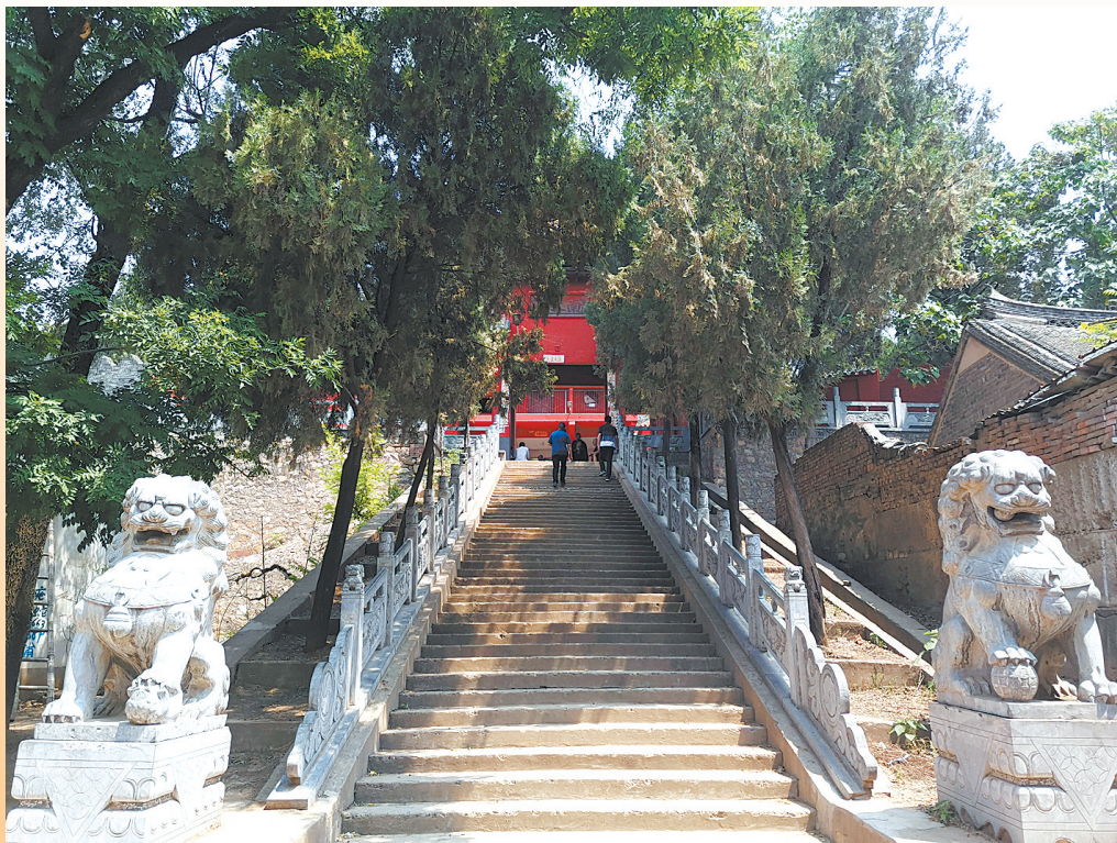
↑拾阶而上南天门 ↓崇兴寺山门 →卧龙宫里的石碑

“王大月宅是由清末富农王大月所建,现存建筑面积为500平方米,正堂建筑5间,东西厢房各3间,宅院毁坏较多,但主要骨架尚存。”王广顺说。