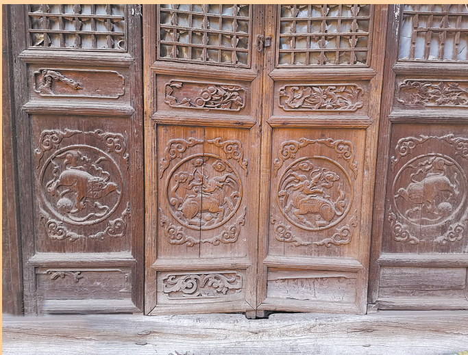
解学士故居内雕刻精美的木门