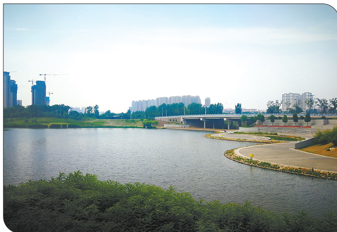
市区湛河西段,河面宽广,绿树环抱