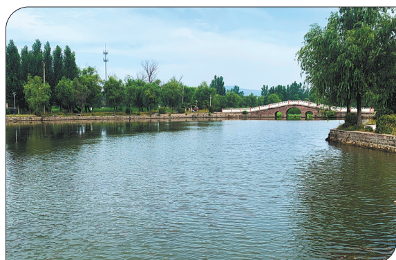
位于市区平安大道东段的东湖,宛如一位恬静、美丽的少女