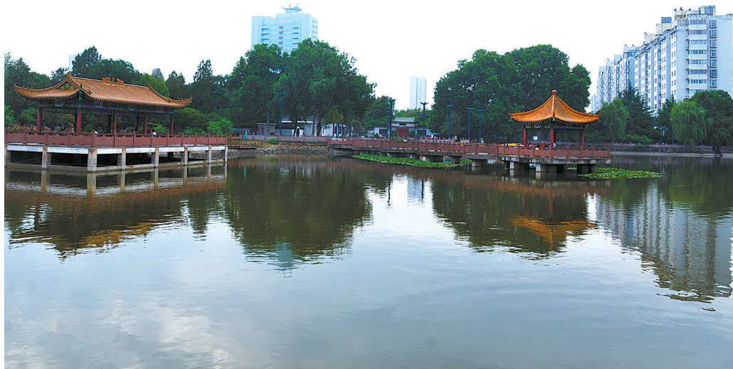
安逸、宁静的河滨公园人工湖