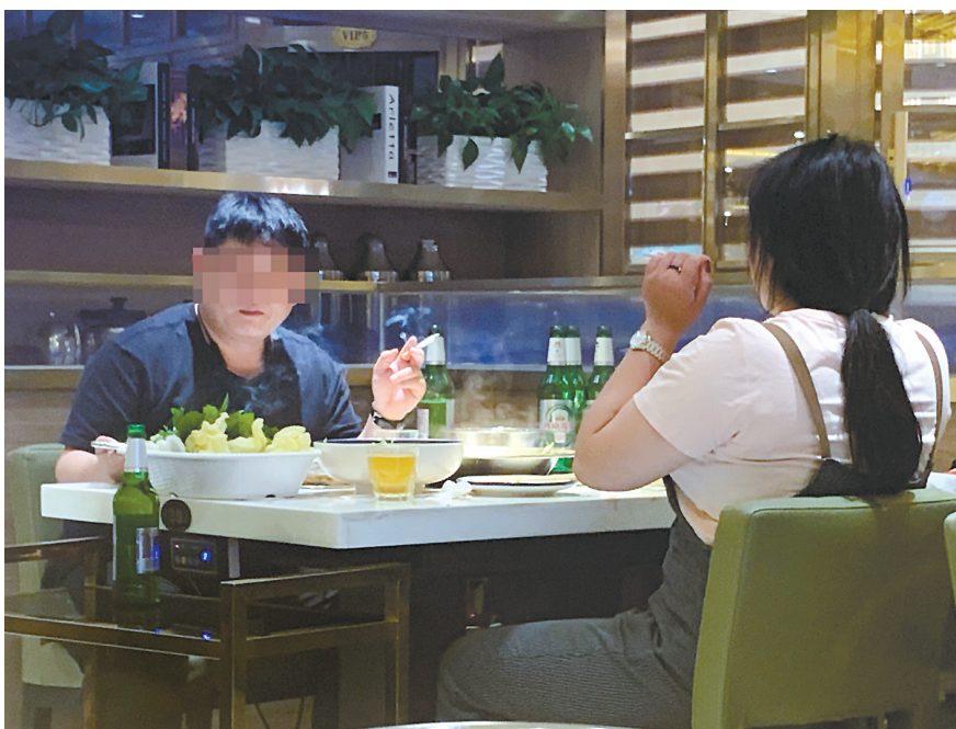
5月27日,北京东城区某餐厅内,一位食客(左)在室内吸烟(手机拍摄)。

北京市控烟协会会长张建枢说,“无烟北京”微信公众号投诉举报平台统计,1月1日至5月28日,共收到控烟投诉举报线索3342件,其中居民楼投诉量位居首位。“少数‘烟民’在家里吸烟怕影响家人健康,却严重忽视了公众健康利益。”