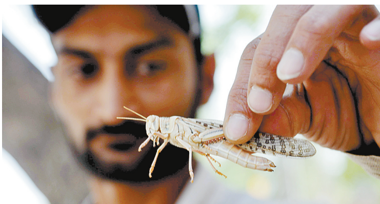
这是5月8日在巴基斯坦海拜拉巴拍摄的蝗虫。据巴基斯坦媒体报道，该国信德省和旁遮普省一些地区近期再次遭遇蝗虫侵袭，对粮食安全构成威胁。