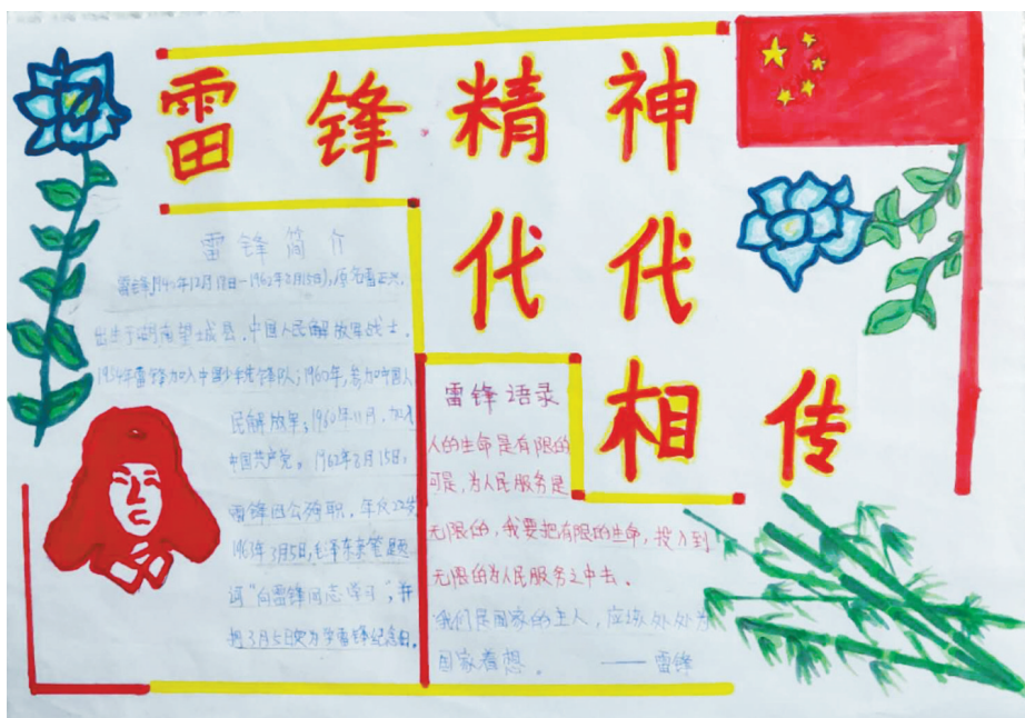
《雷锋精神 代代相传》四(3)班 侯子涵 指导老师：潘丹丹