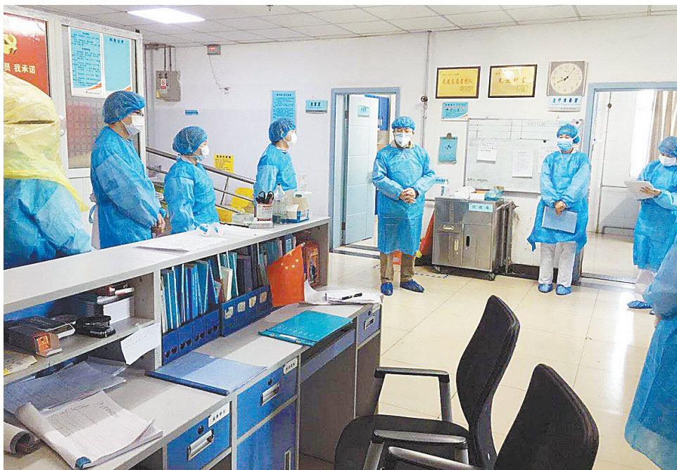
临时发热病房交接班

里最煎熬的就是穿上密不透风的防护服在隔离区的6个小时，那是种头晕目眩、喘不上气的窒息感和无法形容的煎熬。可当她得知同事身体不适时，主动要求跟同事换班，还笑着说：“我年轻，多干一些就当多学点东西。”