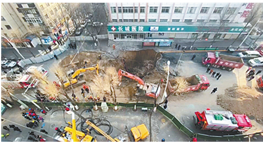
1月14日,多辆挖掘机正在塌陷的坑洞中挖掘救援。