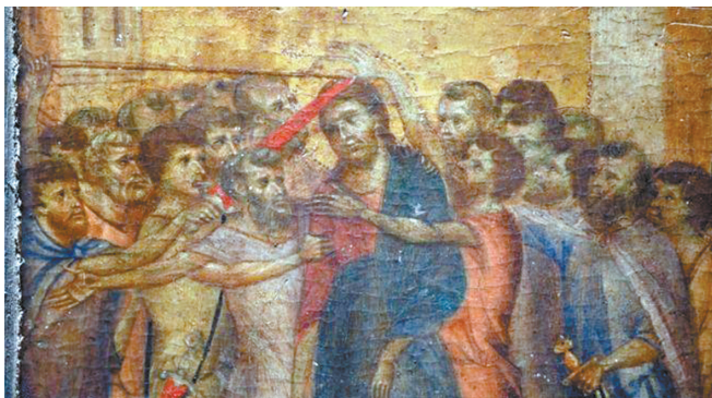
《受嘲弄的基督》油画

1280年左右的《虔诚的双联画》中幸存下来的三幅画之一。另外两幅分别藏在纽约和伦敦的国家美