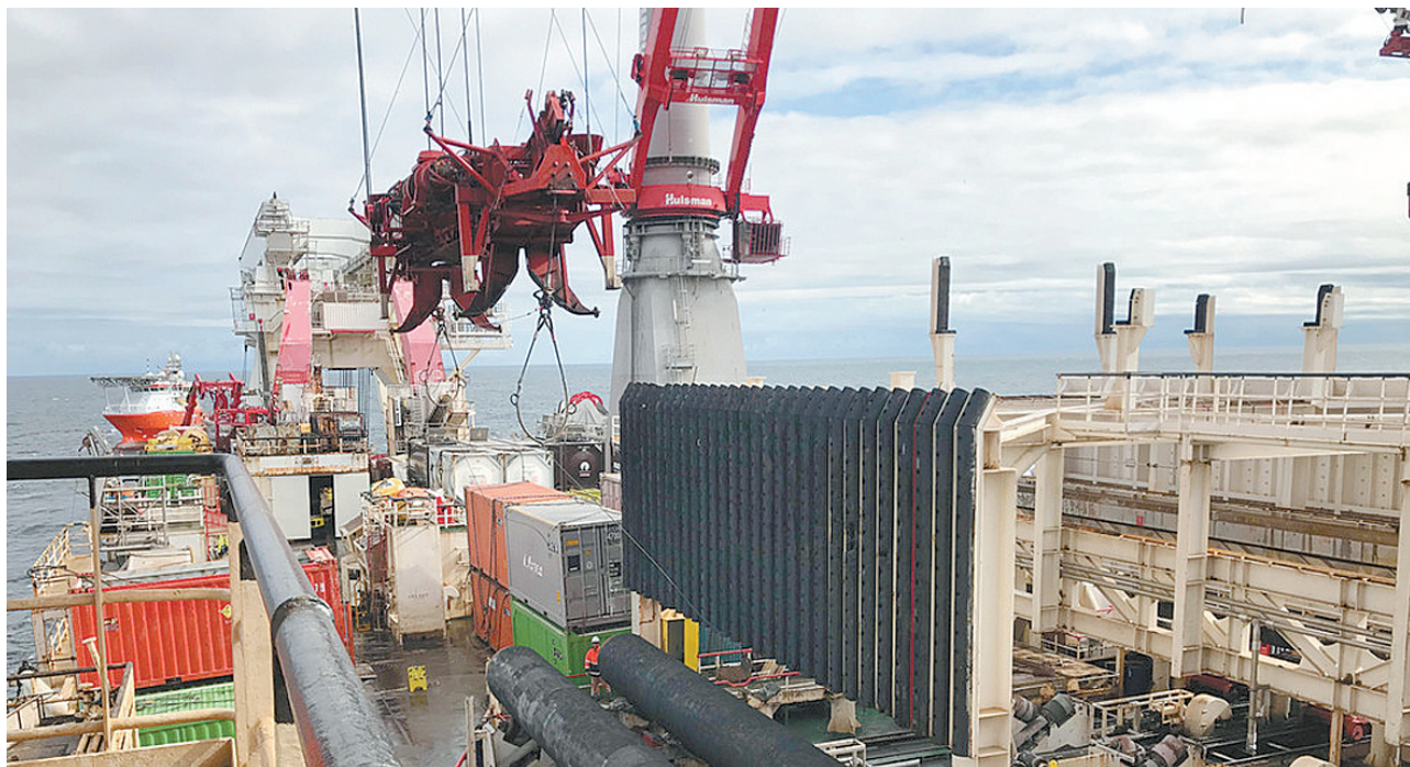
特朗普签署美国防授权法案后,为“北溪-2”铺设管道的瑞士全海洋公司12月21日宣布暂停有关活动。图为瑞士全海洋公司施工现场图。