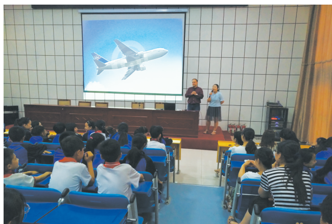
蓝天学校学生在上外教课

为提升教育教学质量,学校结合实际情况制定了教师备课制度、讲课制度、作业批改制度等,通过精细管理,事事有章可循,人人照