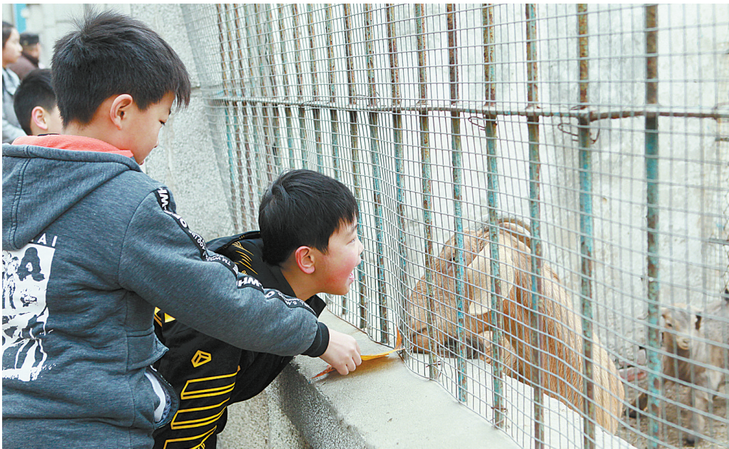
小记者与动物“对话”