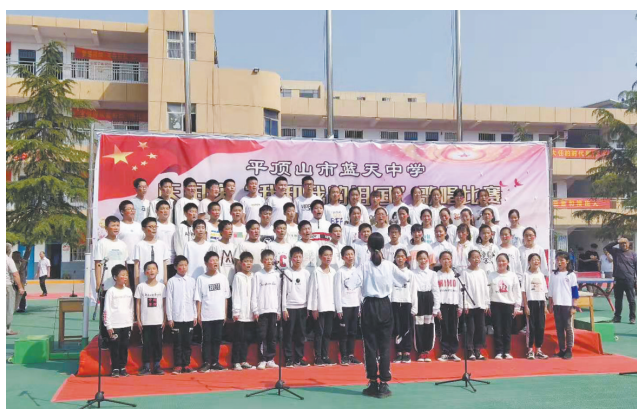
蓝天学校举办“我和我的祖国”歌唱比赛