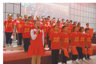
蓝天学校国庆文艺汇演