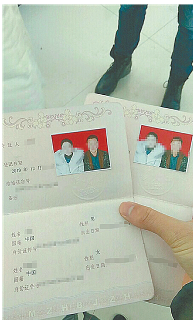
中介展示顾客信息,称其经假结婚成功办理

国家发改委城市中心综合交通规划院院长张国华表示,对于部分居民来讲,即使通过非法的手段也想拥有车牌,暴露出了公共交通短缺的问题,“解决非法买卖车牌,根本上应改善公共交通通勤效率问题”。