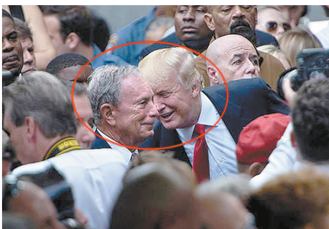
红圈中为特朗普与布隆伯格

据美国消费者新闻与商业频道(CNBC)12月2日的报道,帕斯卡尔在声明中也提到,竞选团队会以个案的方式决定是否与个别彭博社记者接触或回答彭博社的询问。此外,共和党全国委员会